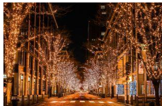
丸の内イルミネーション