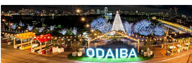
お台場クリスマスツリー

旅程 寄居駅北口(10:30)＝男衾駅西口(10:45)＝JAふかや男衾プラザ(11:00)＝築地(昼食)すし ざんまい奥の院…築地場外市場＝両国～～～お台場＝丸の内仲通り＝JAふかや男衾プラザ (20:00予定)＝男衾駅(20:10予定)＝寄居駅北口(20:25予定)